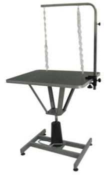
Table hydraulique « tournante » STAR UNIVERSAL TH800 Rotating hydraulic table STAR UNIVERSAL TH800

Notice de montage et d'entretien - Assembly instruction – For maintenance VEUILLEZ LIRE ATTENTIVEMENT CETTE NOTICE AVANT UTILISATION PLEASE READ THESE INSTRUCTIONS CAREFULLY BEFORE USING